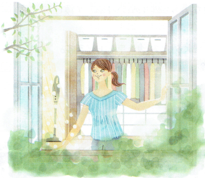
晴れた日に、窓とともにタンスやクローゼットなどの収納スペースの扉を開けて湿気を防ぎましょう。サーキュレーターなどを活用して風の流れをつくれれば、こもった空気も一気にスッキリ。

なかなか手の回らない収納スペースのケアですが、扉を開けて換気するだけでも効果的です。ぜひ挑戦してください。